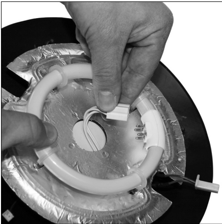
Disconnect the UV-tube.