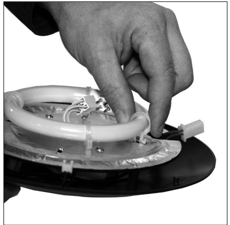
Disconnect 4 x tube holders (finch and turn gently inwards). Snap off the tube holders and attach them to the new tube.