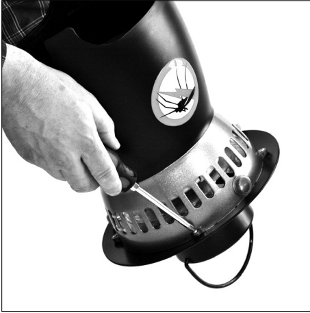
Open up the hat (4 x phillips screws).