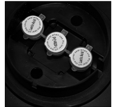
To open lure compartment: Press and turn counter clockwise.