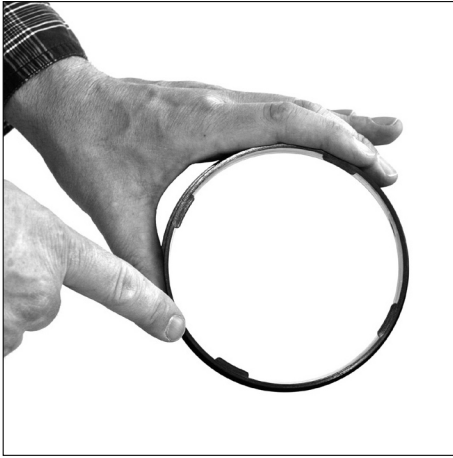
Quick lock adapter. Note position of the bayonette fittings.