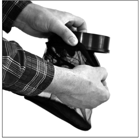
Attach net to quick lock adapter.