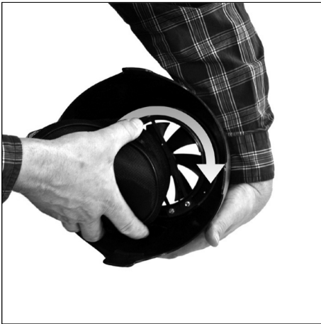
Put quick lock adapter towards fan ring and turn clockwise.